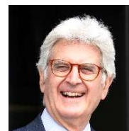
2025-26年度国際ロータリー会長 フランチェスコ・アレツォ